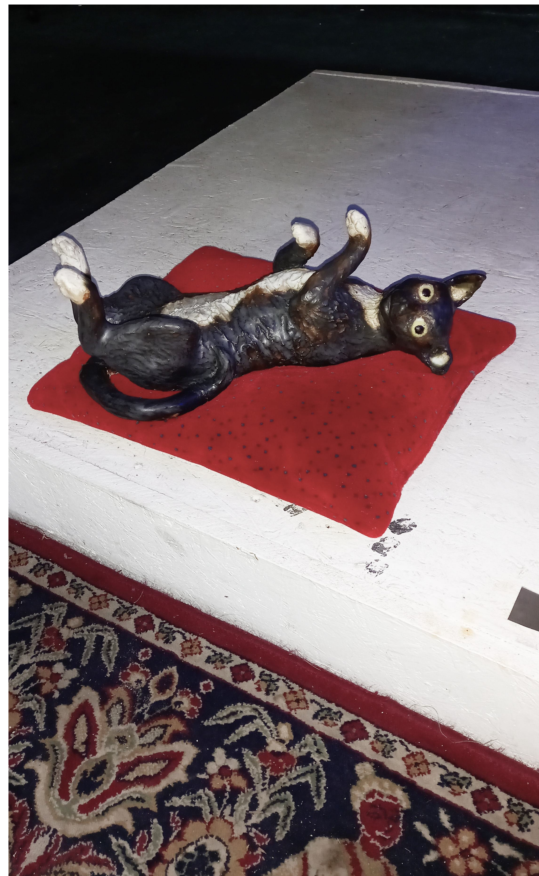
Gabor na Macie , 2023 Ceramika Glina szamotowa, szklivo Wymiary 10 cm x 30 cm