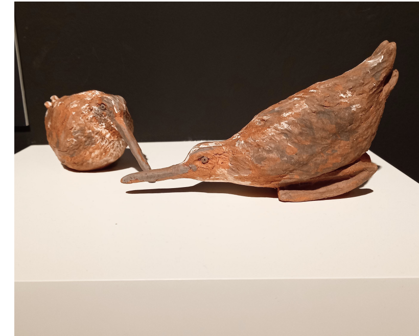
Ostatnie gniazdo, 2023 Ceramika Glina czerwona szamotowa, Angoba