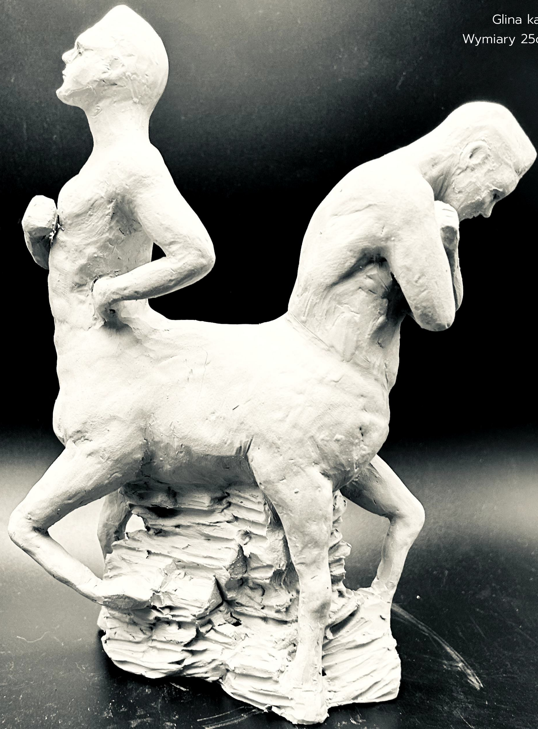
"Gdyby mógł sobie wybrać kształt i stan zostałbym Centaurem" 2024 Ceramika Glina kamionkowa Wymiary 25cm x 15 cm