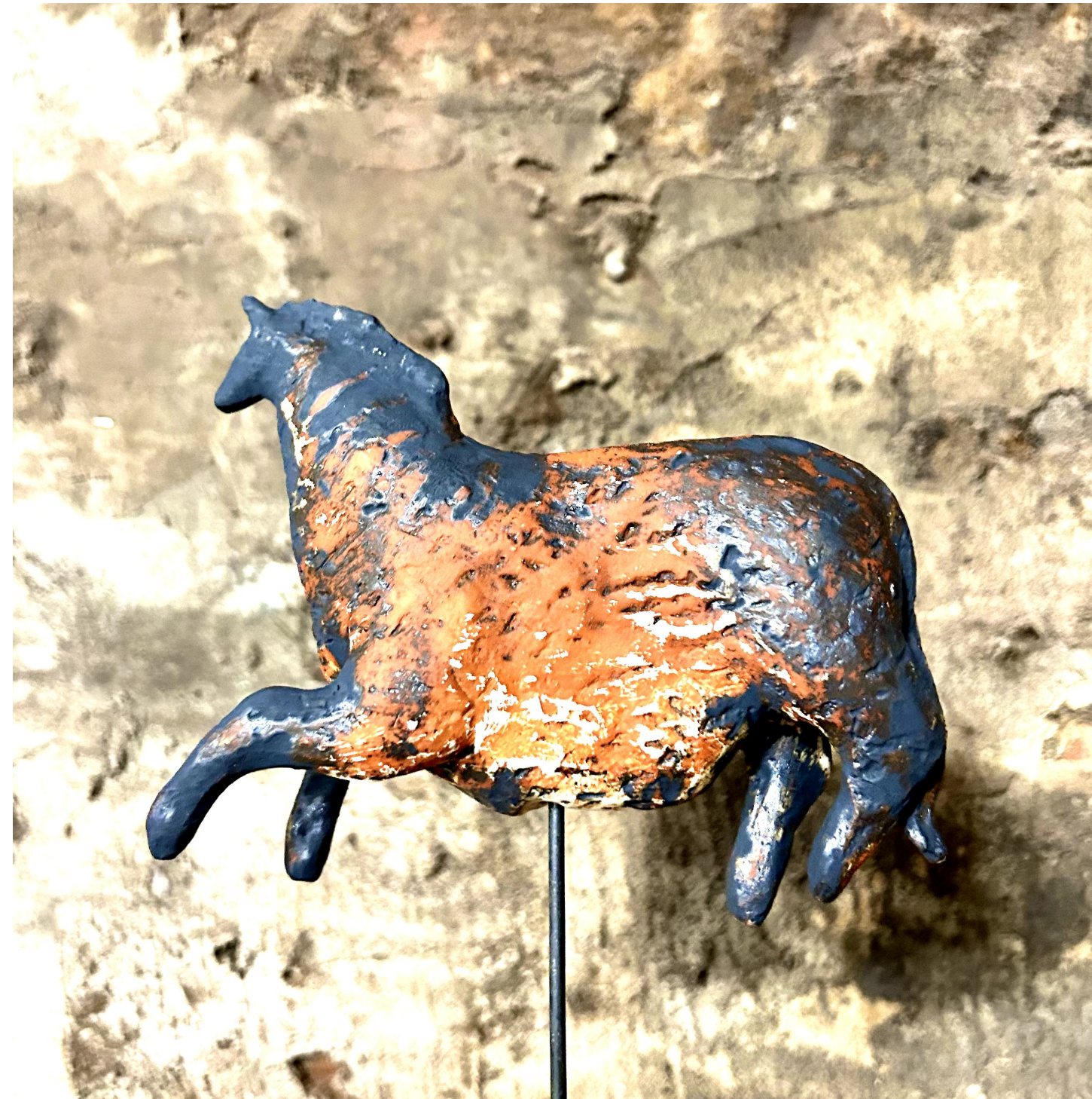
Konik Praśląski, 2023 Ceramika Glina szamotowa Angoba, telenek miedzi czarny