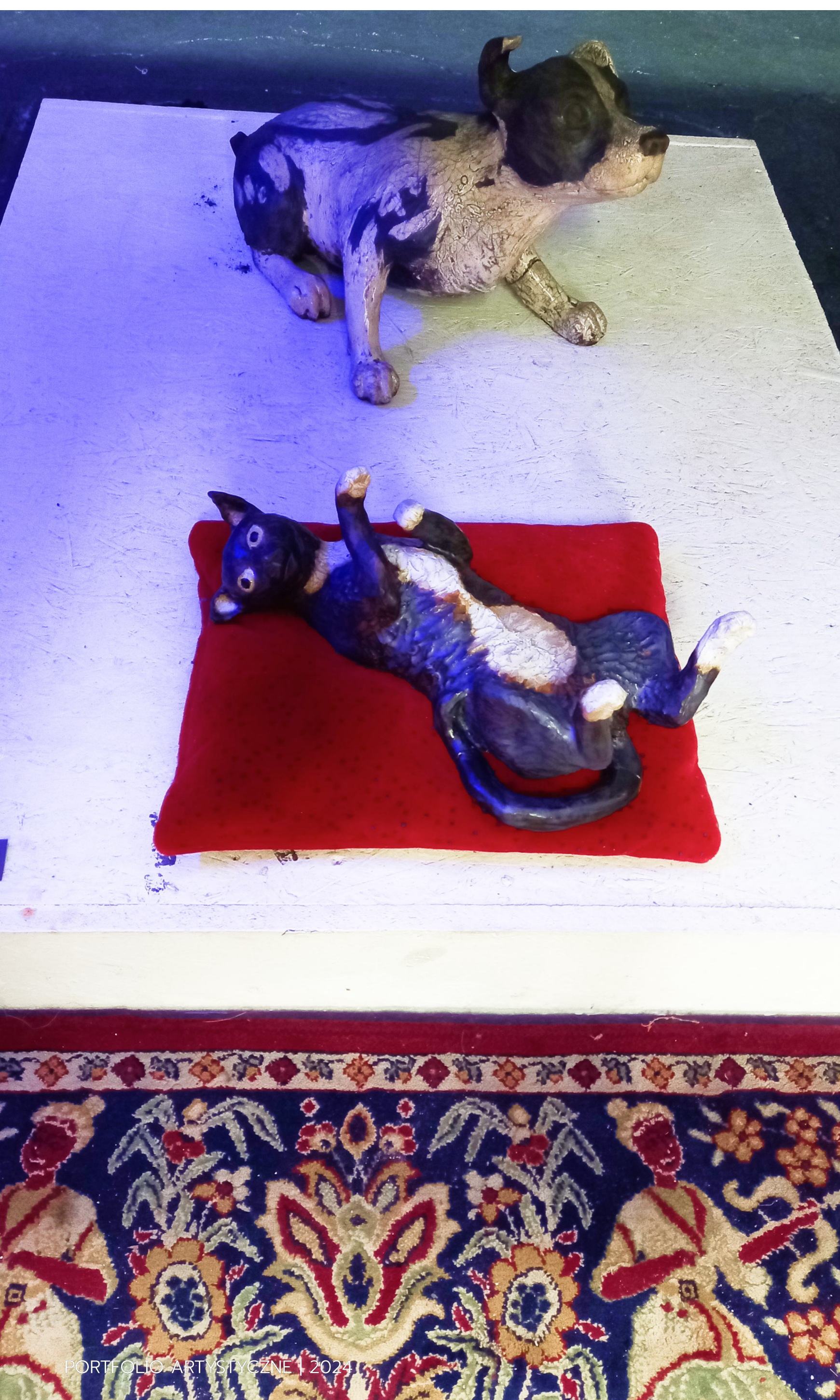
Podsklepek, 2023 Ceramika RAKU Glina szamotowa Wymiary 40 cm x 50 cm