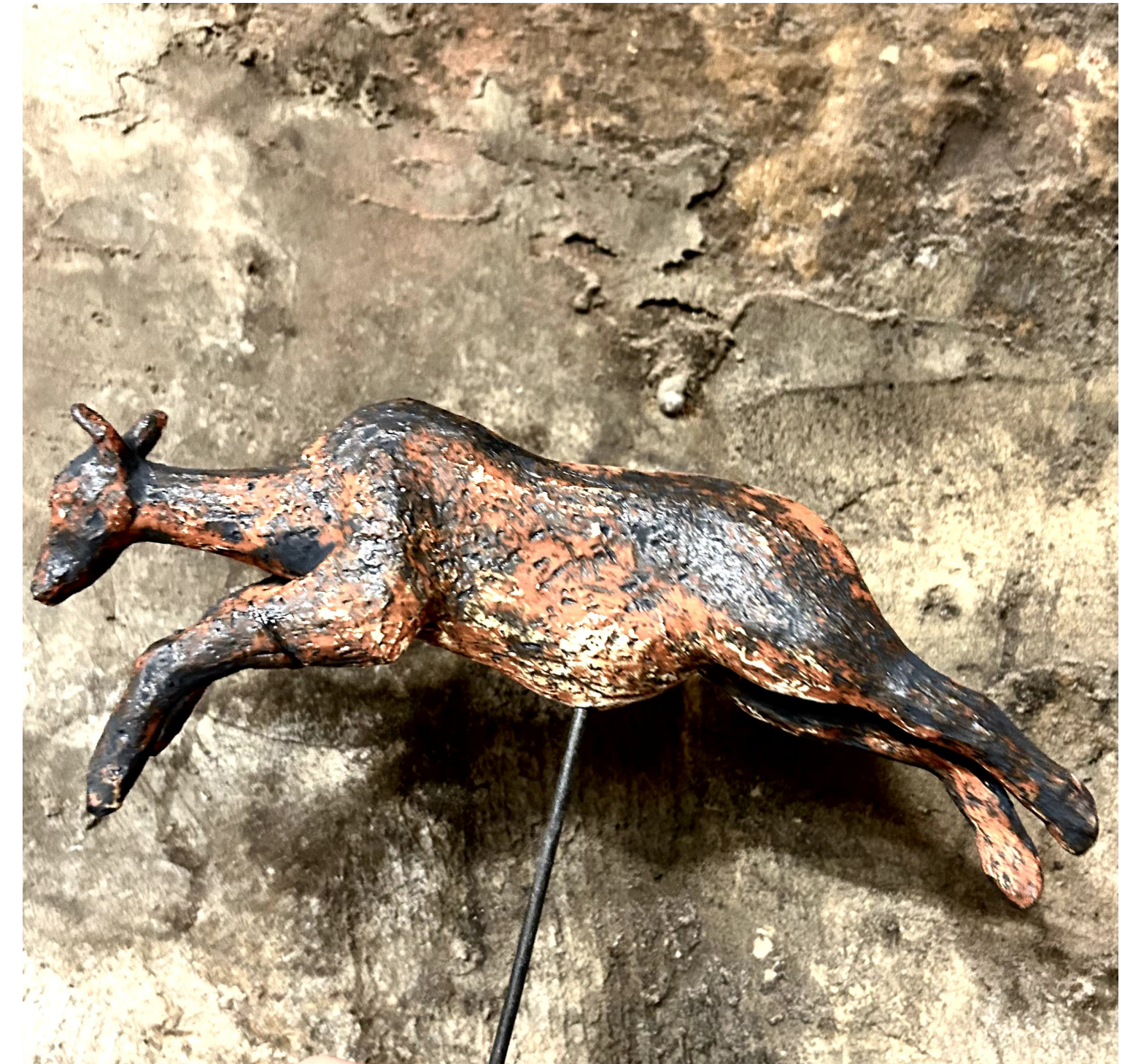
Łania w locie, 2023 Ceramika Glina szamotowa Angoba, telenek miedzi czarny