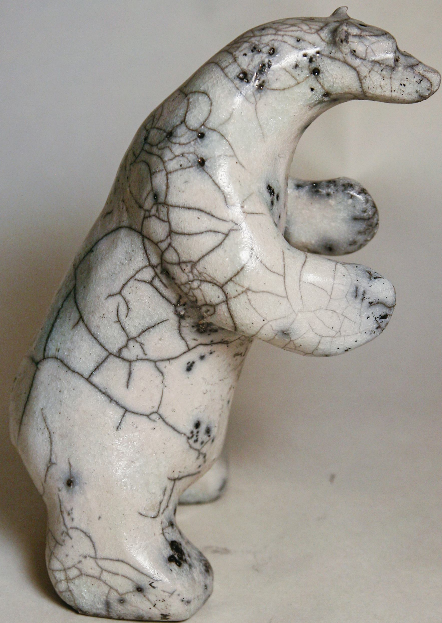
Niedźwiedzie, 2022 Ceramika RAKU Gлина szamotowa, szkliwo