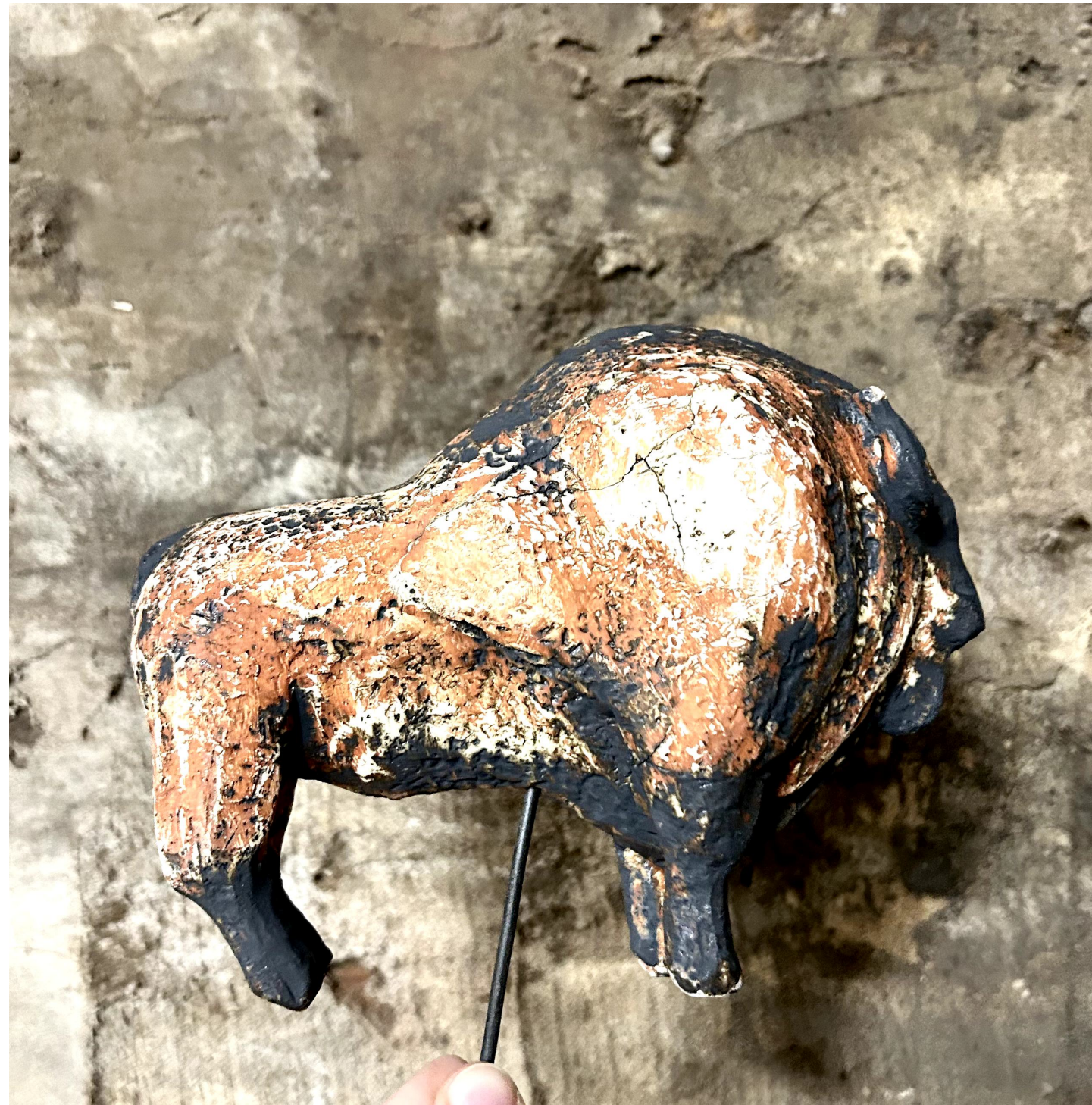
Zaginiony Byk, 2023 Ceramika Glina szamotowa Angoba, telenek miedzi czarny