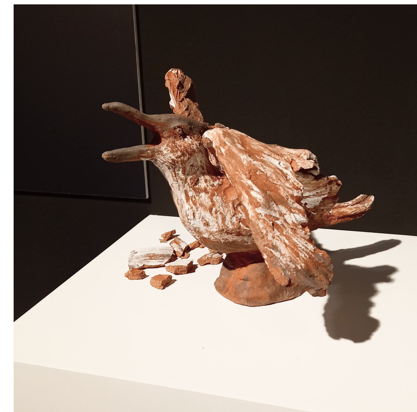
Meve, 2023 Ceramika Glina czerwona szamotowa, Angoba