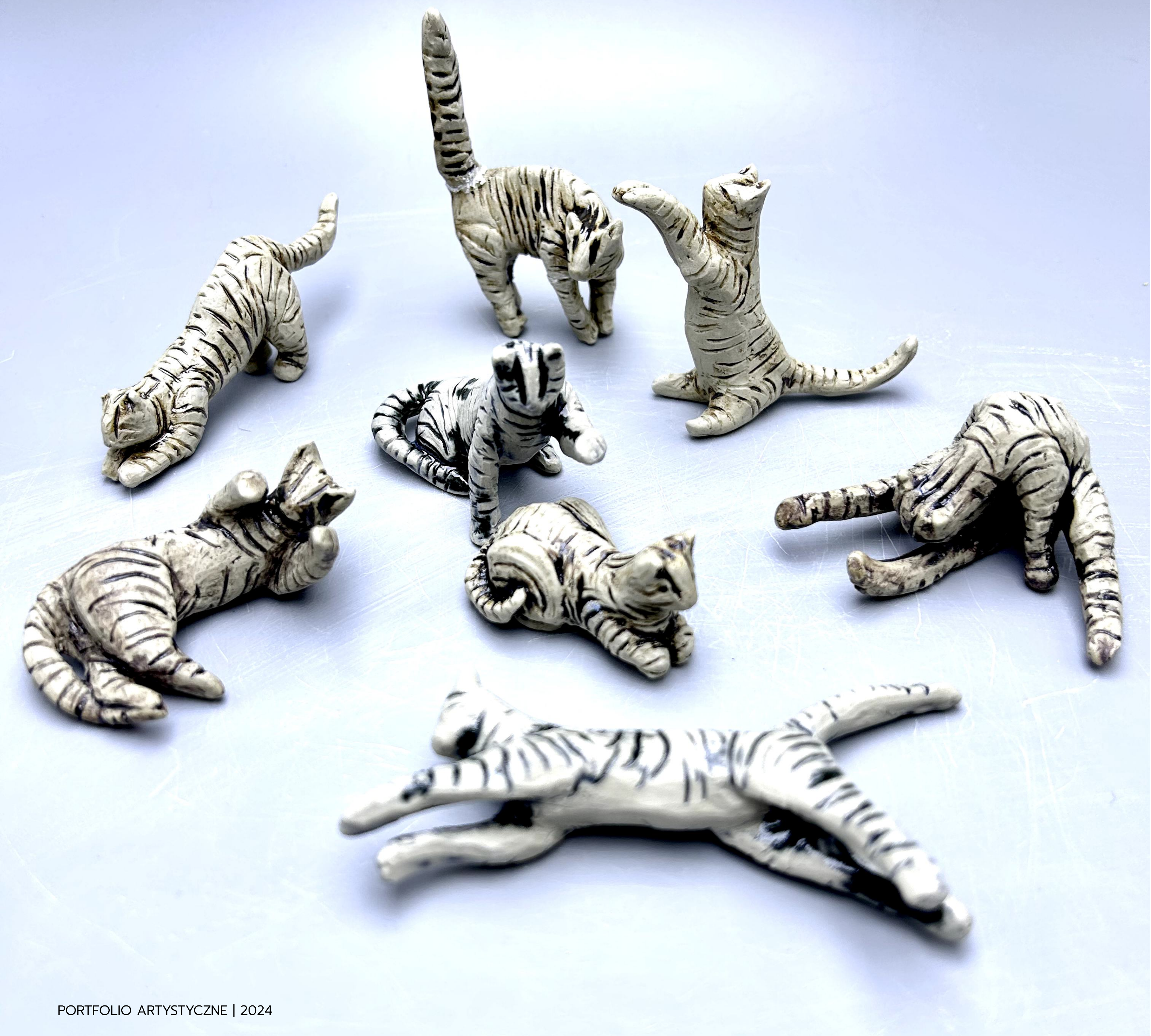
Miniaturowe kotki, 2024 Glina kamkionkowa Wymiary 5-7 cm